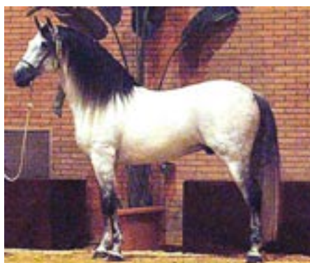
Afkom efter Lebrijano III: Panadero VIII - opdrættet af stutieriet Muira. Panadero VIII vandt bl.a. bedste bevægelser til SICAB.