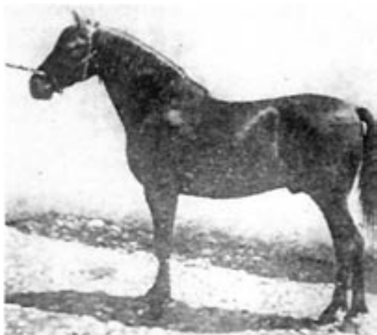
Malusos far, Lebrero, fra Baones stutieriet. Læg mærke til den noget tynde halepragt.

Malusos kropsbygning virkede en smule ranglet i forhold til de meget kraftige og fyldige "kriags-agtige" heste, som Bocado typen.