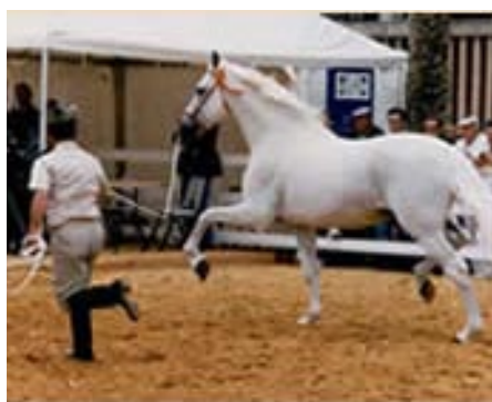
Den højt meriterede avlshingst Leviton, som er eftertragtet pga. sine fantastiske bevægelser.

bevægelser og ikke noget løft). Paradoksalt nok er det lige nøjagtigt disse karakteristika, som verdens dressurryttere søger efter, og som de spanske avlere gør alt for at få frem i deres avl. Det har derfor gjort, at afkom efter Malusos sønner, Agente, Lebrijano, og Leviton er i meget høj kurs og er meget efterspurgt i Spanien.