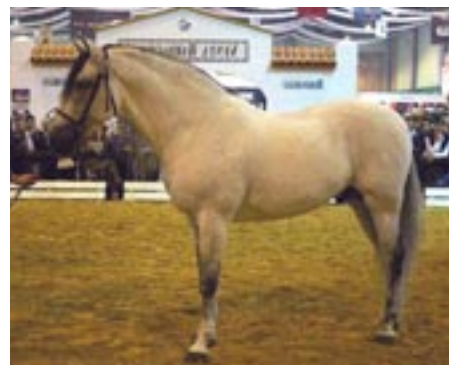
Afkom efter Lebrijano III: Rondeño IX - opdrættet af Bohorguez stutieriet. Blev spansk champion i 2002 og vandt WEG holddressur i 2000. Bemærk hans farve! Står registreret som skimmel i stambogen, men det passer vist ikke....