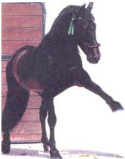
Lebrijano III, en berømt søn af Agente med Maluso som farfar.