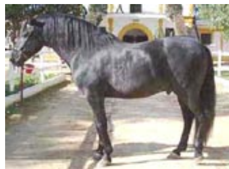
Afkom efter Lebrijano III: Letargo - opdrættet af militærets stutier, hvor han virker som avlshingst.