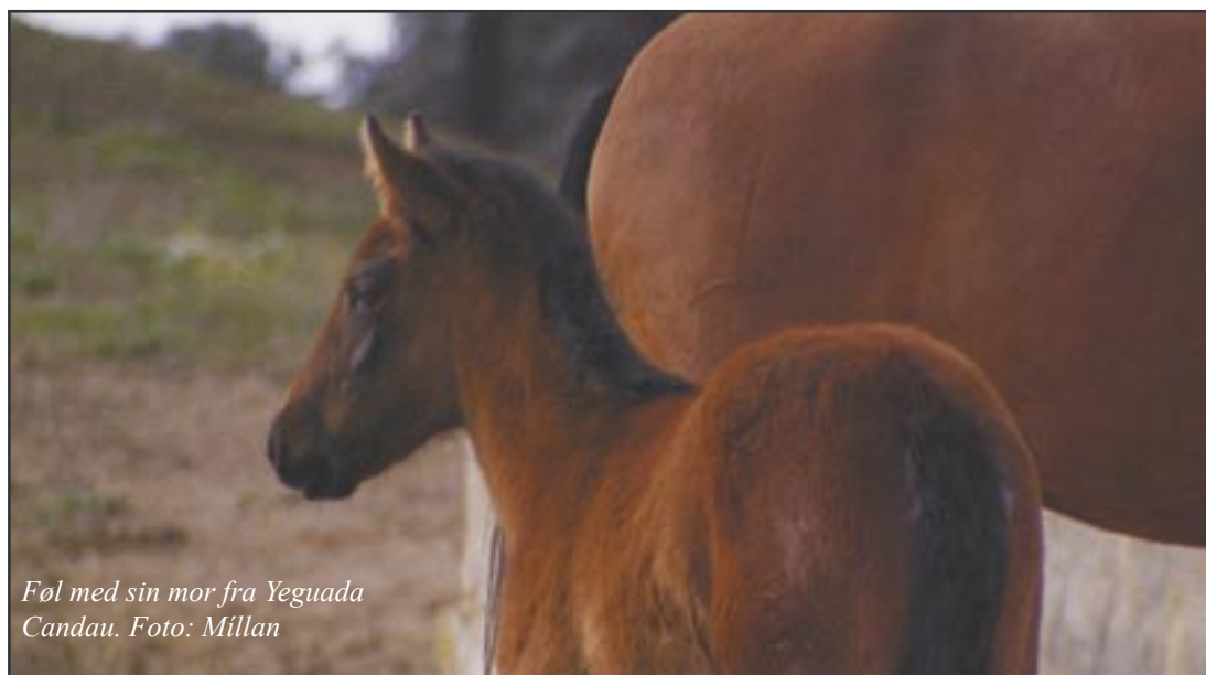
Føl med sin mor fra Yeguada Candau.

Da de fleste aborter sker i denne periode, er det almindeligt, at dyrlægen scanner eller