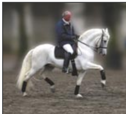
Trianero MS fra barokshow på Christiansborg.