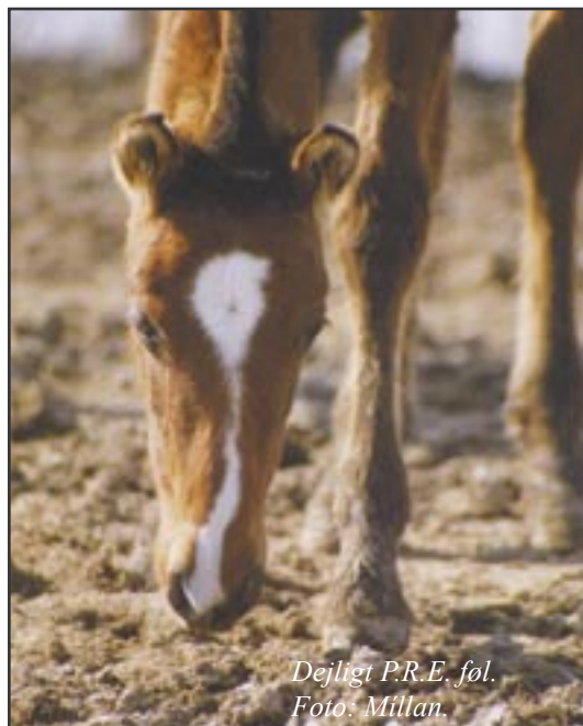
Dejligt P.R.E. føl.

Til alle jer, som har sat jeres hopper i fol første gang, har jeg et rigtigt godt råd. Lad være med at læse i alle mulige bøger om alt det, som kan gå galt ved en foling! I får simpelthen dårlige nerver og kan ikke sove om natten. Som sagt foregår størstedelen af alle folinger helt normalt, og det er de færreste forundt at få lov til at overvære det. For hopper, som har fået føl tidligere uden problemer, er der ikke noget at være nervøs for. For maidenhopper, dvs. førstegangsfolende, er det en god idé lige at holde lidt øje med dem under drægtigheden. Selve folingen skal de nok klare i bedste stil.